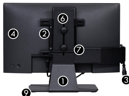
FALTBAR Zweimonitor-Halterung, zusammengeklappt