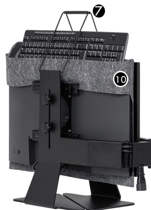
FALTBAR Zweimonitor-Halterung, transportbereit